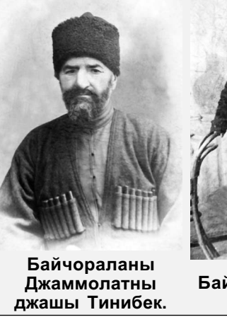
Байчораланы Джаммолатны джашы Тинибек.